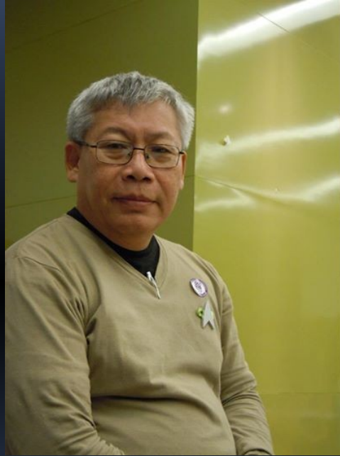
เชิงชัย ไพรินทร์ ชมรมนิยายวิทยาศาสตร์ไทย